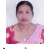
हेमकला बि.क. का.पा. महिला सदस्य