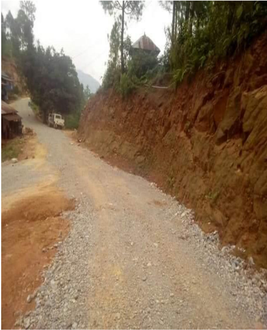
देउराली ऐरावती मोटरबाटो