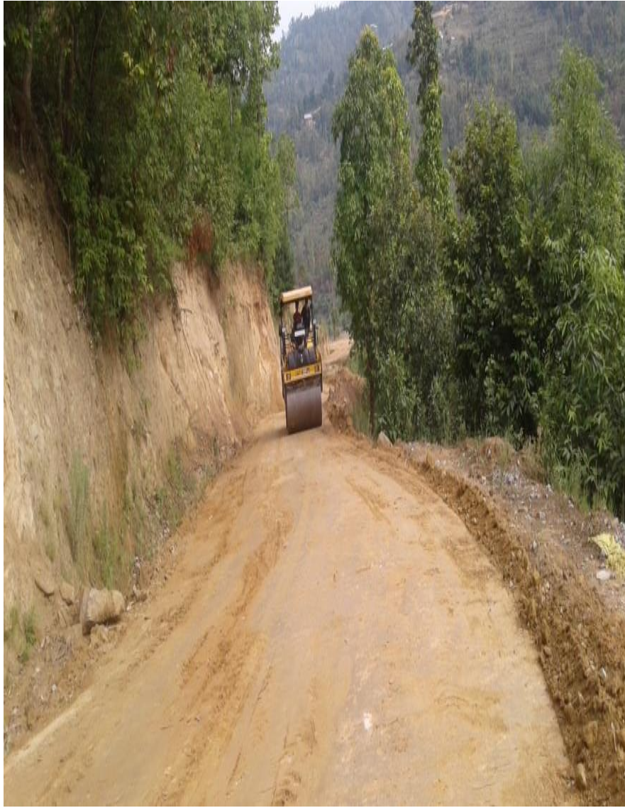
भेडामारे सिमलपानी मोटरबाटो