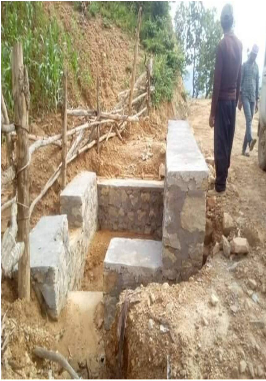
देउराली ऐरावती मोटरबाटो