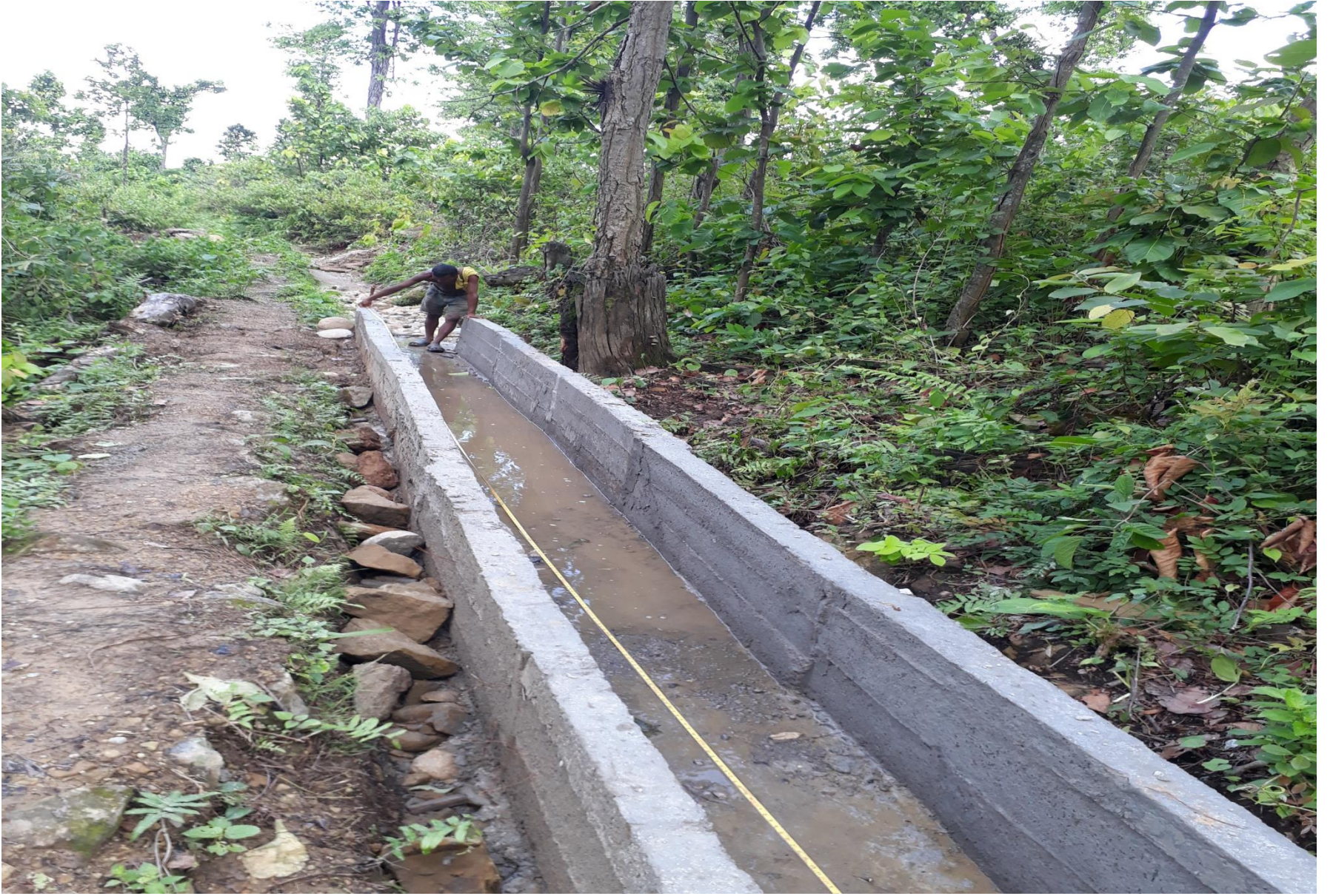
खोरमोर सिंचाई कुलो