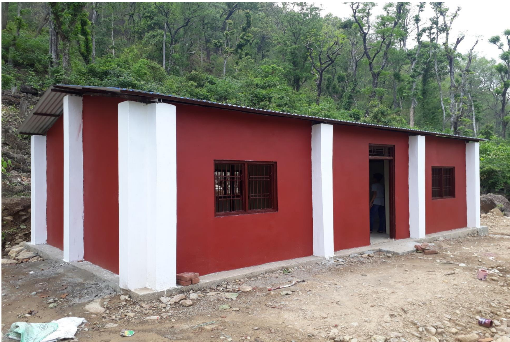
पावरामा निर्माण भएको सामुदायिक स्वास्थ्य इकाई भवन