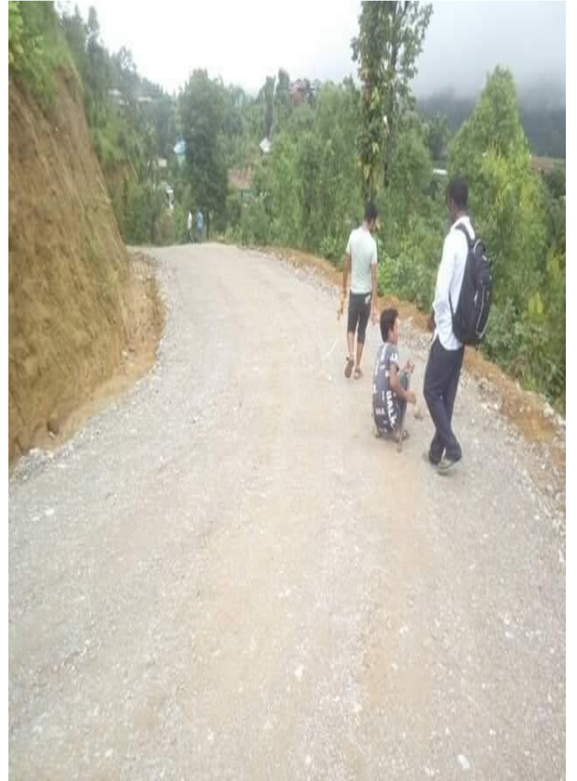
ठाडा जुकेना जलुके लामाताल मोटरबाटो