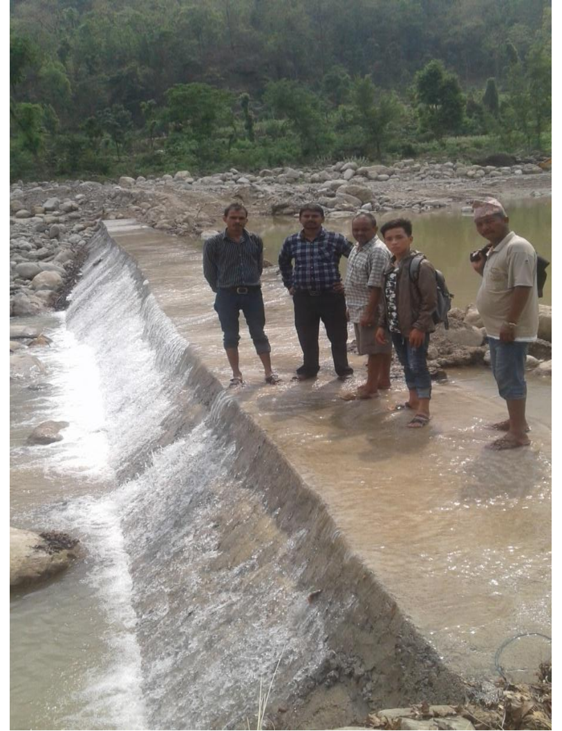
वणगंगा नदीमा निर्माण गरिएको चेकड्याम