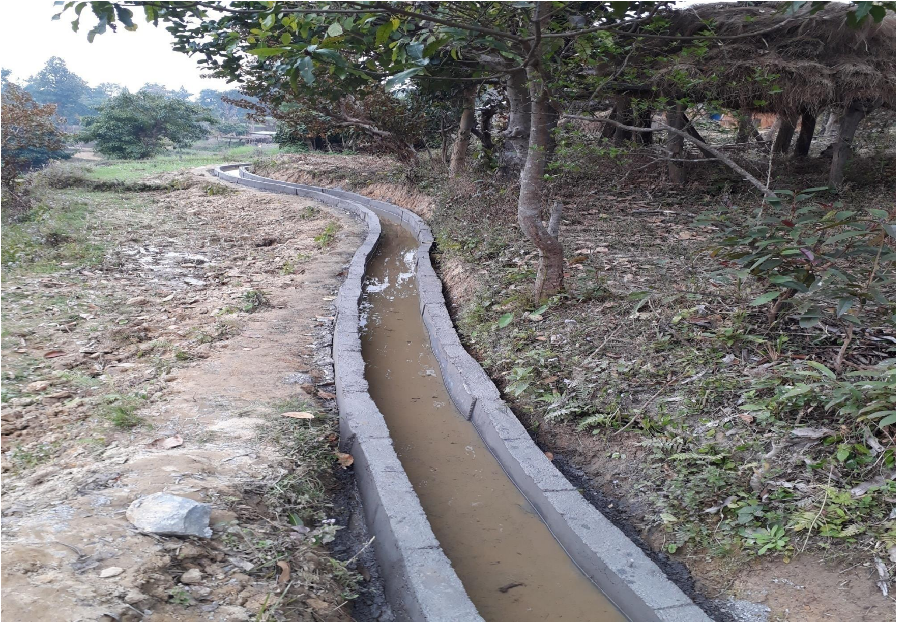
सुखौराको सिंचाई कुलो