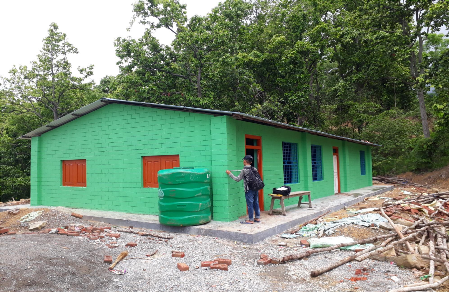
सुखौरा सामुदायिक भवन