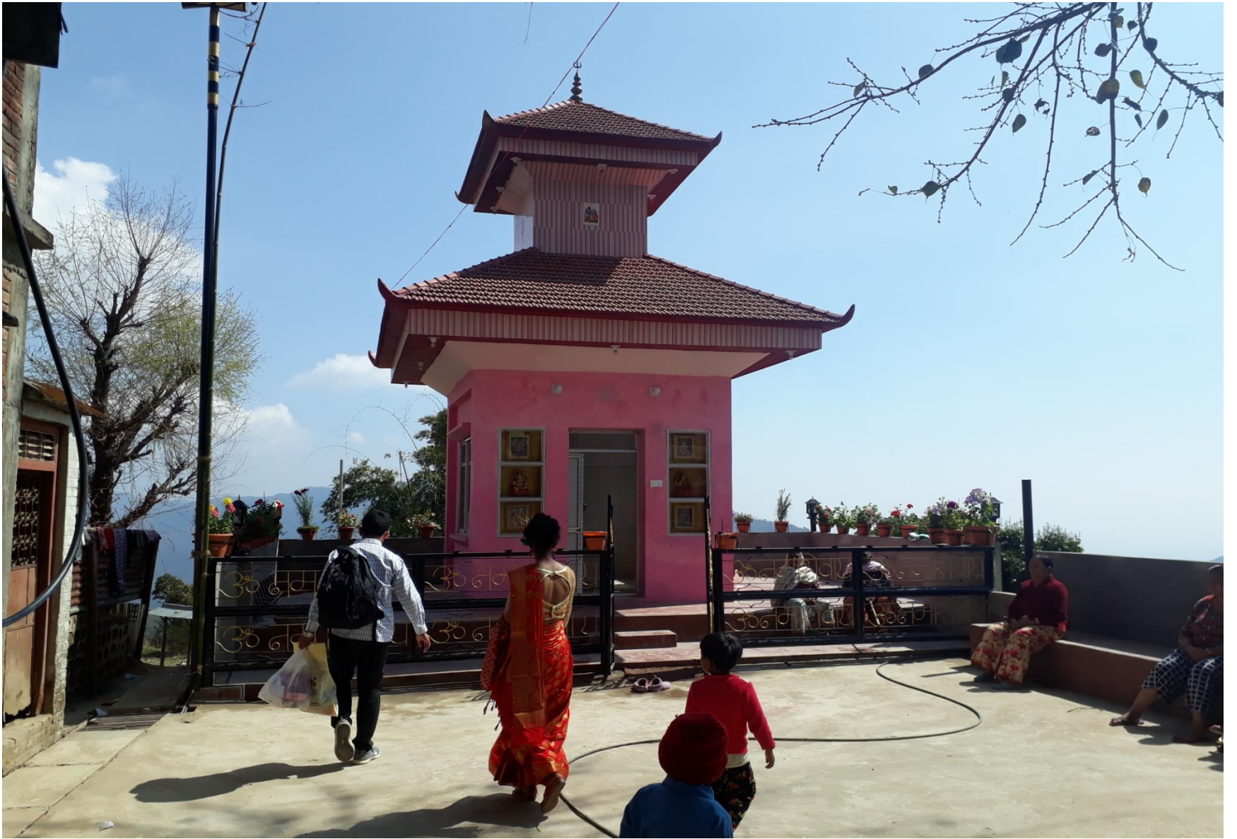
शिवालय मन्दिर अमराई