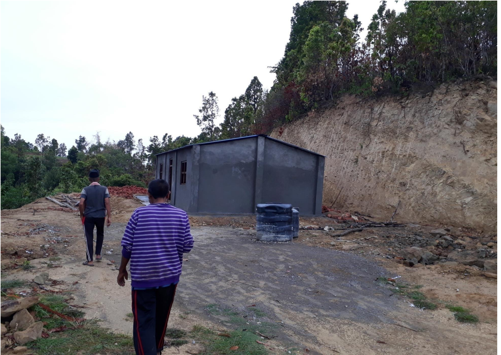
करेचुलीमा निर्माण भएको सामुदायिक स्वास्थ्य इकाई भवन